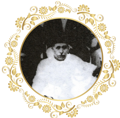
دکتر شیخ حسن عاملی بنیانگذار جراحی در مشهد