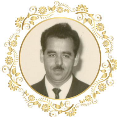
دکتر فخرالدین محلاتی پایه گذاران جراحی در مشهد